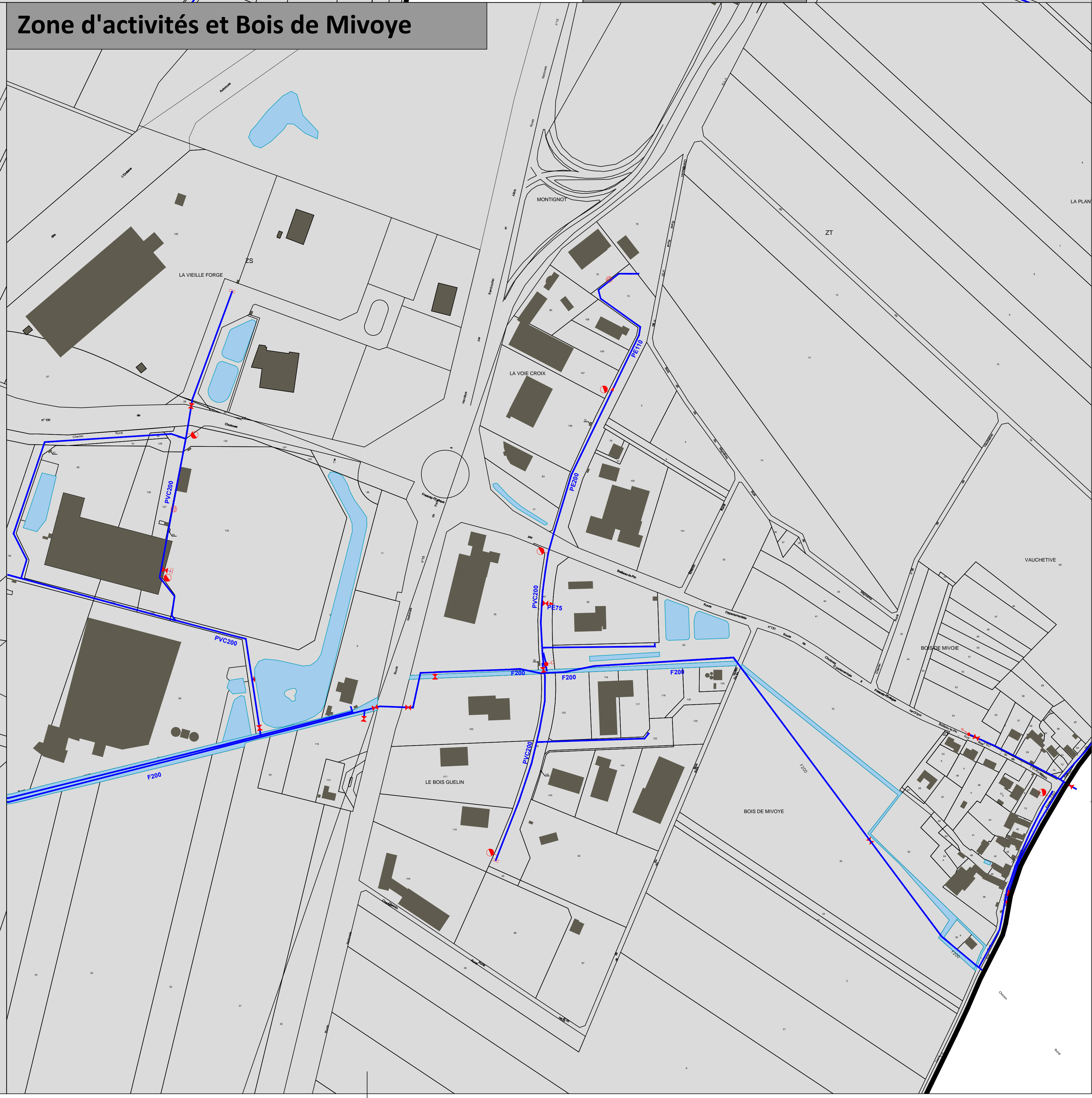
Zone d'activités et Bois de Mivoye